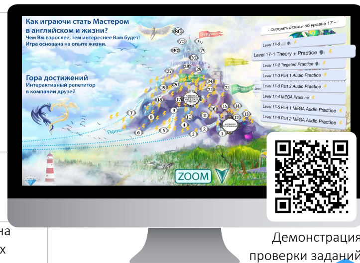
Демонстрация проверки заданий